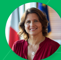
ROXANA MARACINEANU, Ministre des sports

Si l'État investit dans Paris 2024, c'est parce qu'au-delà des médailles et de la célébration, les Jeux sont un accélérateur unique pour le développement du sport en France. En termes de pratiquants, d'équipements mais aussi de transformation vertueuse et durable de nos organisations comme de nos modes de vie. À nous d'en faire aussi un levier de croissance pour nos entreprises et un tremplin pour notre jeunesse. Nos Jeux vont mobiliser 150 000 emplois et créer des opportunités dans de nombreuses filières. Nous devons tout faire pour que ces métiers trouvent preneurs. C'est aussi à cela que l'État veillera.