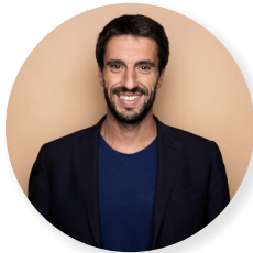
TONY ESTANGUET, Président des Jeux de Paris 2024

Il est indispensable que les Jeux de Paris 2024 profitent à toutes et à tous sur l'ensemble du territoire. C'est à cet effet que nous avons mis en place une charte emploi et développement territorial qui réserve 25 % des marchés aux TPE, PME et structures de l'ESS et 10 % des heures à des publics éloignés de l'emploi. Nous sommes fiers de cette dynamique collective qui s'est engagée avec nos partenaires !